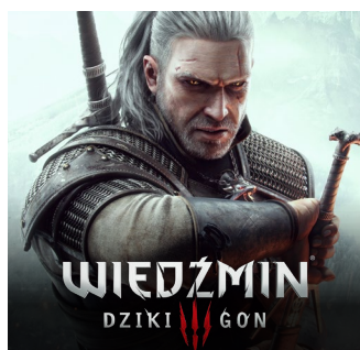
2015 – PC, Xbox One, PS4 2019 – Nintendo Switch 2022 – Xbox Series X|S, PS5