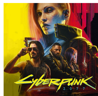
2020 – PC, Xbox One, PS4, Stadia 2022 – Xbox Series X|S, PS5 2025 – Nintendo Switch 2