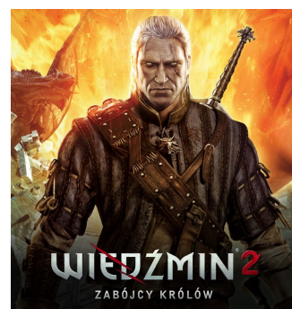
2011 – PC 2012 – X360