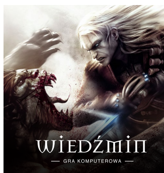
2007 – PC