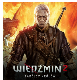
2011 – PC 2012 – X360