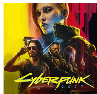
2020 – PC, Xbox One, PS4, Stadia 2022 – Xbox Series X|S, PS5 2025 – Nintendo Switch 2